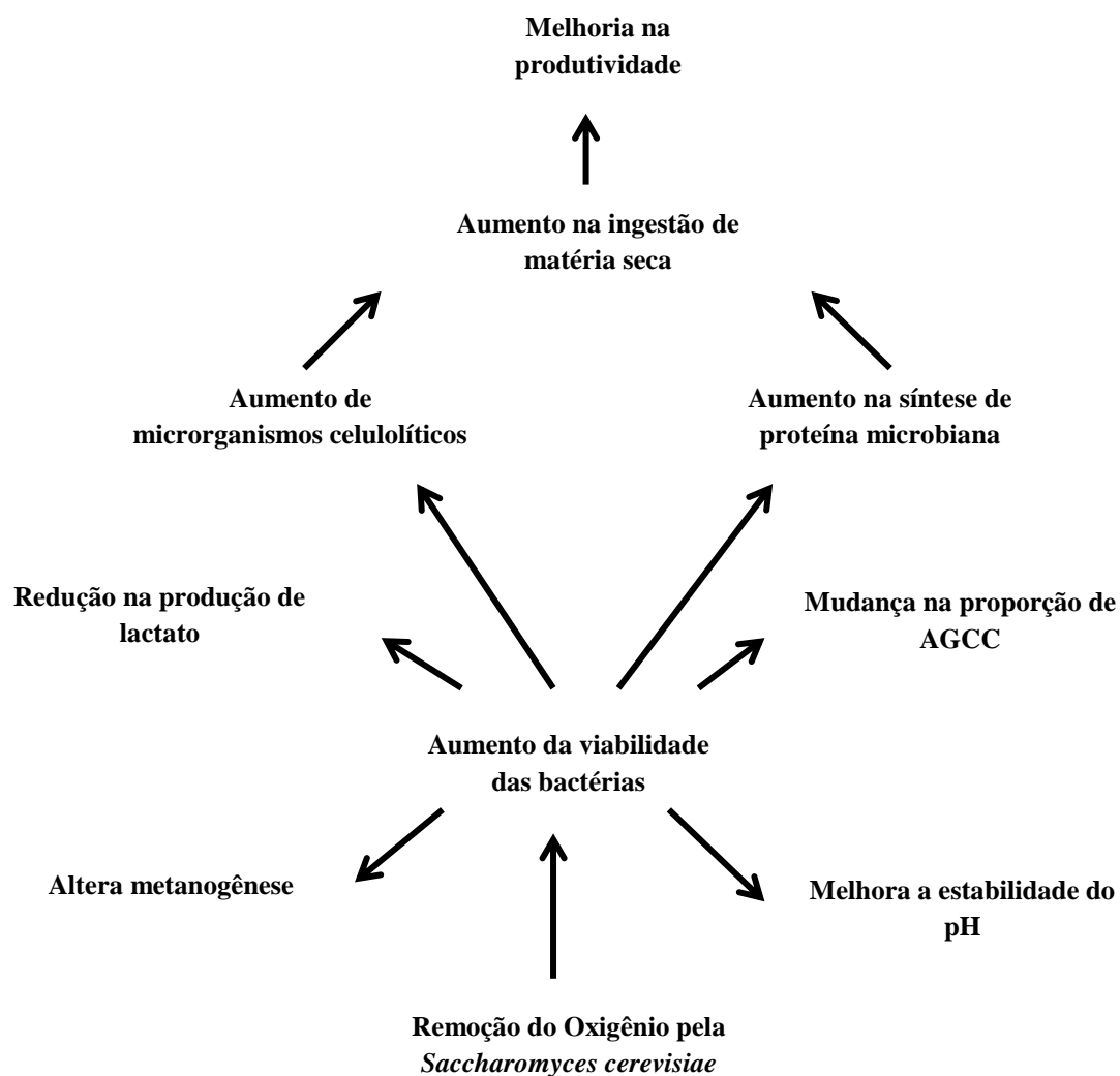
Figura 1. Modo de ação dos fungos Saccharomyces cerevisiae como aditivos alimentares para ruminantes. Adaptado de Wallace (1994)

matéria seca e conseqüentemente a produção. Depois de muitos estudos no final do mesmo século, Wallace (1994) afirma que as leveduras auxiliam na manutenção das atividades metabólicas em anaerobiose, porque as bactérias celulolíticas aumentam e a presença do ácido dicarboxílico estimula as bactérias que utilizam o ácido láctico como as pertencentes aos gêneros Selenomonas spp, Anaerovibrio spp, Megasphaera spp e Propionibacterium spp, aumentando a estabilidade da fermentação ruminal e a degradabilidade da fibra (Figura 1).